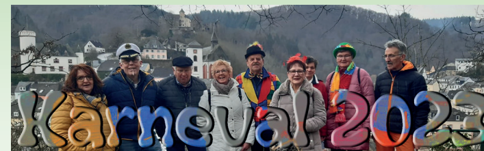
16. Februar: Fetten Dinnichdisch