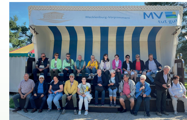
23. - 27. September: Kulturreise nach Usedom