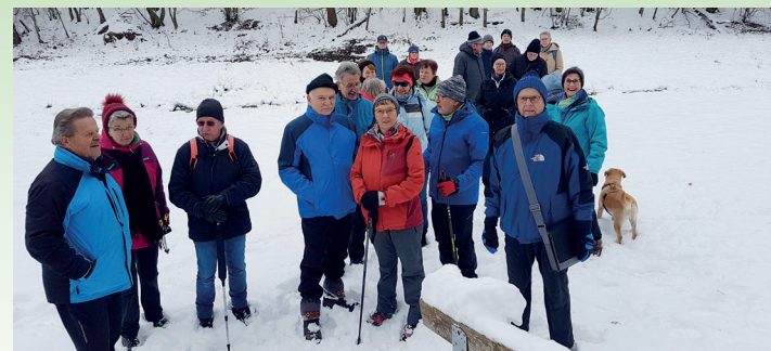
22. Januar: Winterwanderung beim Schwimmbad