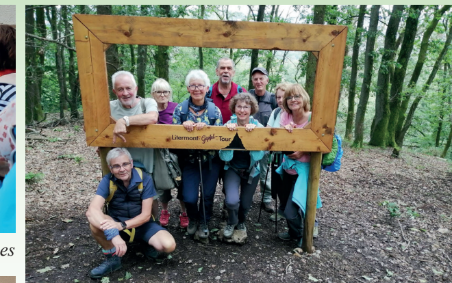
Traumschleifen des Saarlandes vom 01. - 06. August